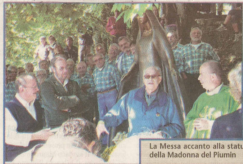
La Messa accanto alla statua della Madonna del Piumin

Nell'insieme, una giornata partecipata e riuscita, sia per l'accoglienza familiare che caratterizza Bagneri sia per la bellezza delle immagini e delle parole che Gianfranco Bini (recentemente insignito tra l'altro del riconoscimento di "Amico della Valle d'Aosta") offre con il suo nuovo lavoro dedicato a questo piccolo angolo della Valle Elvo.